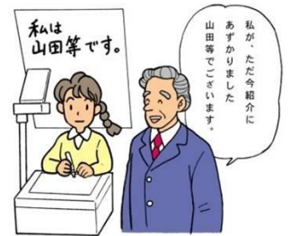
例：手書き要約筆記の様子

※講習会修了後、栃木県要約筆記者認定試験を受験し、合格後、要約筆記者として活動する意思のある方