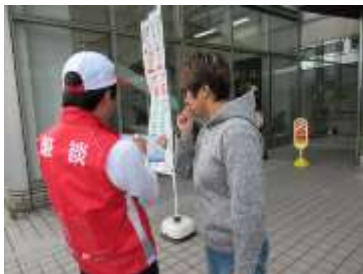
▲ホワイトボードを使って筆談しています