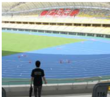
▲カンセキスタジアム（新・陸上競技場）観客席にいちごのデザイン。

また、令和3年度開催の情報支援スタッフ養成講座の準備として、テキスト・手話DVDなどの教材作成や、指導内容を確認する演習を行っています。