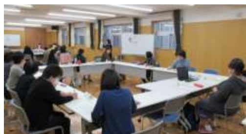
▲演習後に全員で振り返りを行いました