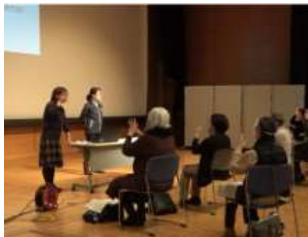
▲▶大会の場面を想定した、手話・筆談それぞれの演習の様子（11月15日、指導者リーダー研修）。