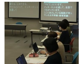
▲パソコンで協力して入力します