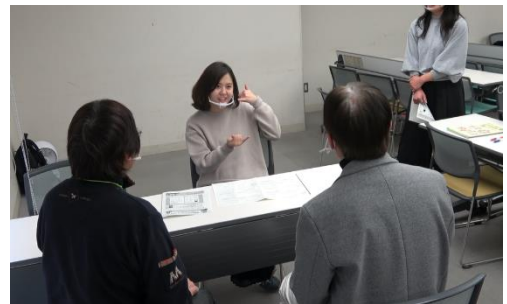
▲ろう者の手話を見て通訳の勉強中