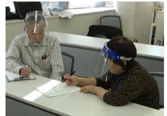
▲難聴者にノートテイク