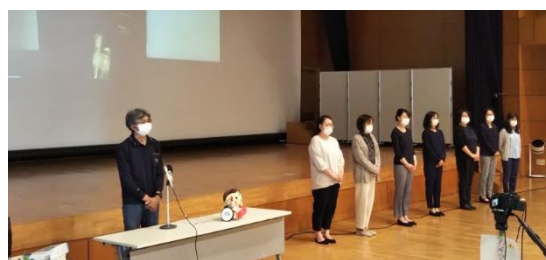
▲5月16日研修会で挨拶しました

緊張と不安もある中と思いますが、4月24日に新人研修を終え、いよいよ通訳活動のスタートです。今後のご活躍を期待しています！