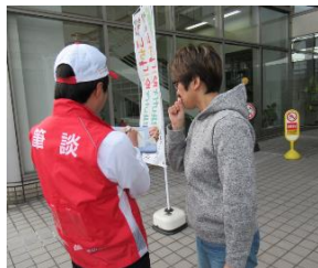
▲情報支援スタッフの活動例 (上・手話/下・筆談)

すでにお申込みをされた皆様も、ぜひ周りの方をお誘いください。ご協力をお願いいたします。