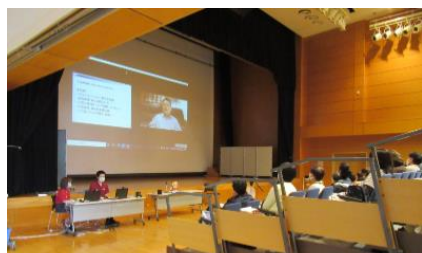
▲会場と各自宅を Zoom で接続