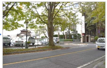
「本町合同ビル駐車場」はシンボルロードを釜川沿いに曲がった先が入口です(^^) /